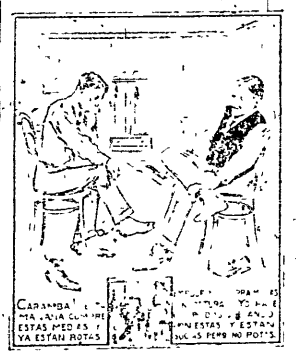
CARABANDA... YA ESTAN ROTAS...